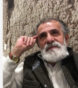
نووسینى ريبوار ھەمە شەريف