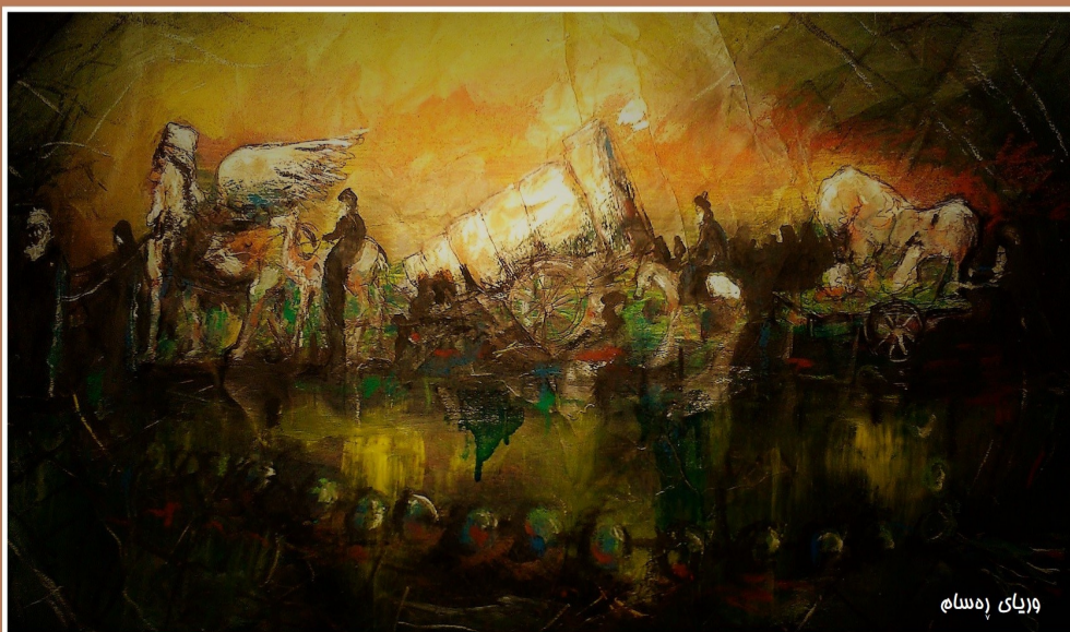
وریای ره سام

له کاتیکیدا رۆژانه هه والی تالانی و دزی و ده سته به راکرتی زه وی و بازرگانی و هه والی ته خشان و