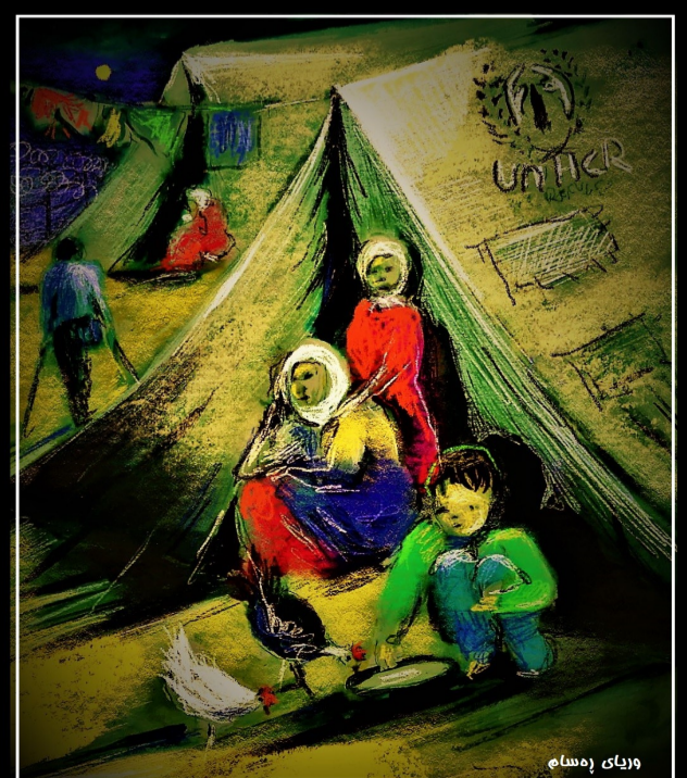
وریای ره سام