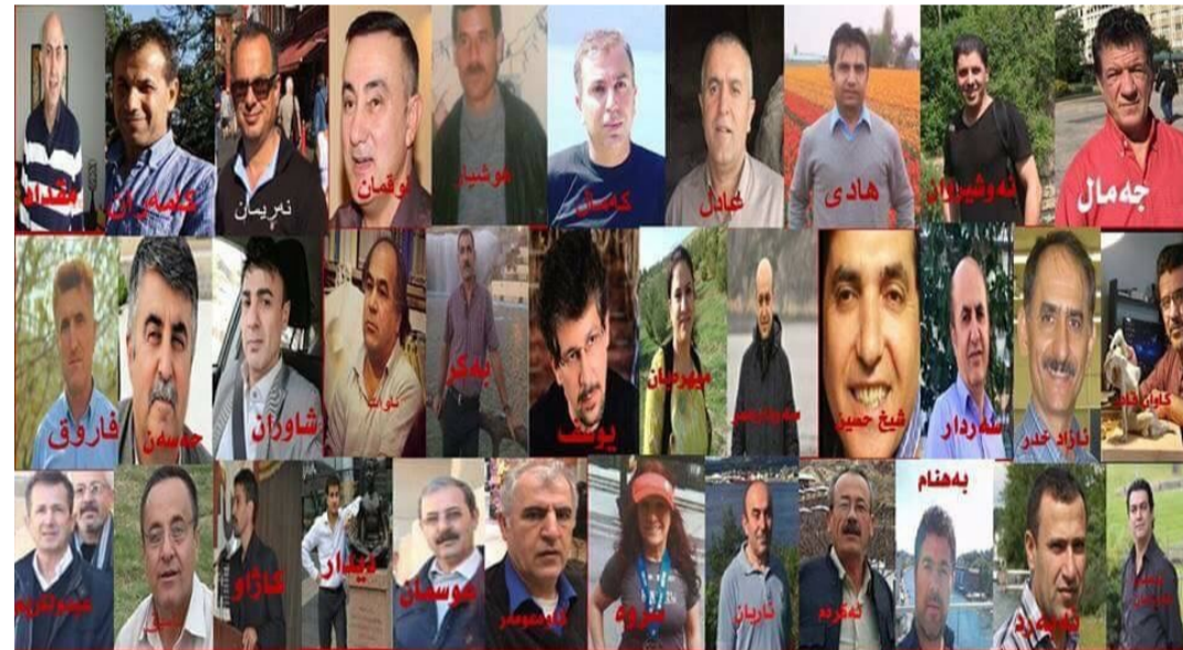
هه ندیک له زيندانیه چه پ وکومونيسټه کانی نه منه سورده که له را په رینه که ی سالی ۱۹۹۱ روژي ۸ مارس به هوی راپدینه که وه له لایه جلا وه رانی راپه ريوه وه نازاد کراون. کاوه عومه ر نامادی کرده

ساواکه مان بچینه دره وه. خو شبه ختانه تا ټیره پلانه که مان سه ری گرت و توانیمان دربار بڼ. له دره وه برای شیخ حوسه یمنان بڼی مه سه له که مان تیگه یانده و بردینی بۆ مالیک که نه وانیش ناویان (سه ردار و سروه) بو، خرمه تیان کردین. به یانی چوین بۆ مالی چیمه نی خوشکی سه ردار، و پاش دوو روژ چوین بۆ مالی پورم له زهرگه ته. پاشان نه وه ی هه ولماندا که په یوه ندی بکه ین به