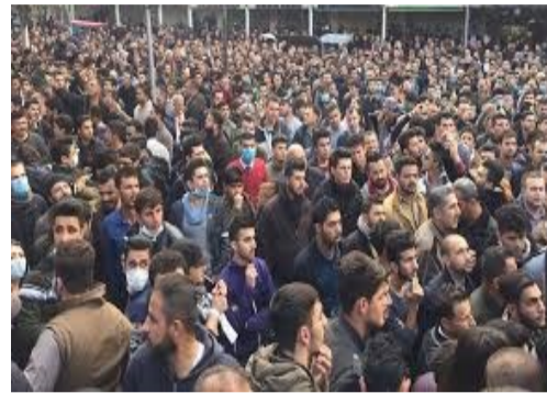
زۆر نمونەمان هەیه وهك یادکردنە وهی