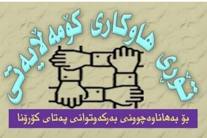
بۇ بەھاناۋەچوونى بەرکەوتوانى پەتاي كۆرۇنا