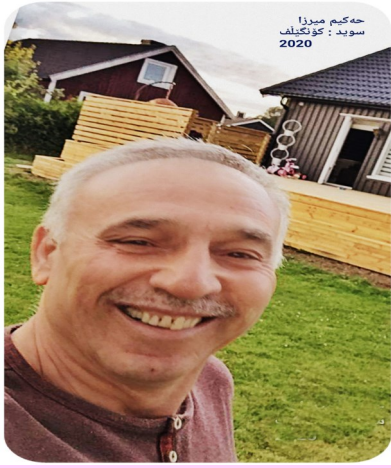
حكيم ميرزا سويډ : كوشه ي 2020

ره ندي" به جلوه برگى (كه ريل) وه، لاره مل لاره مل دانيش تبوو. ئه ژنو ي نابوو به سنگيه وه، كه له كه ئه ژنو كاني كر دبوو به سهرين بؤ سهرى. مووه كاني قزه