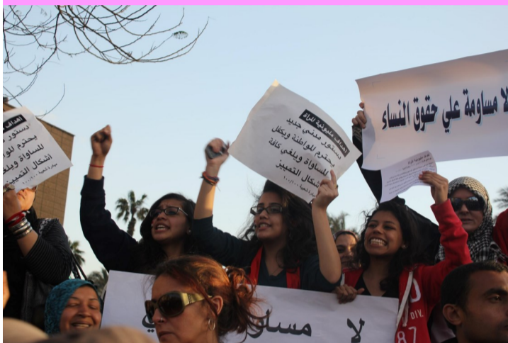
رووداوەكانى ناو خۆپىشاندانەكانى عىراقەو سەرەكتەىكى كەم وىنەى لە مېژووى ھاوچەرخى سىياسى عىراقدا...

دواى ئەوھى موقتەدا سەدر فتواى دا بەوھى دەبى ژنان و پياوان لەخۆپىشاندانەكاندا لەيەكترى جياكەرتەو، ژنانى شۆرشگىر و بەرابەرىخوازى عىراق بانگەوازى وەستانەو و خۆپىشاندانىان بەرووى ئەو فتوايەدا راگەياند، و بەروارى ۱۳ ئەم مانگە گەرەتەرىن خۆپىشاندانىان لە مېژووى عىراقدا بەدژى ھەول و فتواى موقتەدا سەردا كرد و بە دروشمى "دەستورىكى مەدەنىمان دەوى كە ريز لە ژنان بگريت و يەكسانى ياسايى زامن بگات، و دژى جياكارى و ھەلاوردن بىت، وەلامىكى توندى سەدر و ئىسلامى سىياسىيان داىووە و نىشاناندا كەبەشىكى سەرەكى و كارىگەرن بۆ گورانكارى و پاشەكشەپىكردن بە كۆنەپەستى و ھەلاوون و بىمافى... ئەم وەلامە بەكردەو و شۆرشگىرانەى ژنان بە سەدر و رەوتە ئىسلامىيە سەدر ئاساكان، نەك ھەر سەدر، بەلكو سەرچەم رەوت و لاىنە كۆنەپەستە ئىسلامىيەكانى ھەراسان كردووە. ئەم خۆپىشاندانەى ژنانى عىراقى يەكەك لەگەشتەرىن