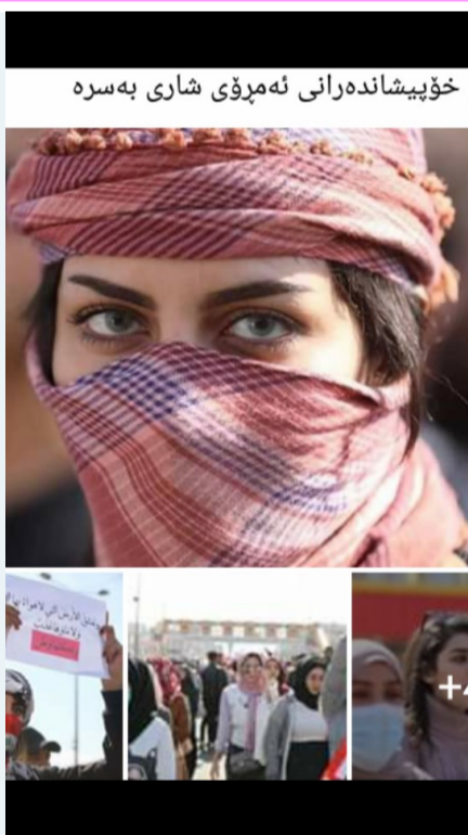
خۆپىشاندەرانى ئەمروى شارى بەسەرە

چاويان بەتۆ ھەئناىت لە ( زانست ) زياتر لە شەبەنگى ئازادى چاوەكانت دەترسن . .. لە ( دۆزەخ ) زياتر لە يەكسانى بوونى تۆ دەترسن ...سەفین 12\2\20