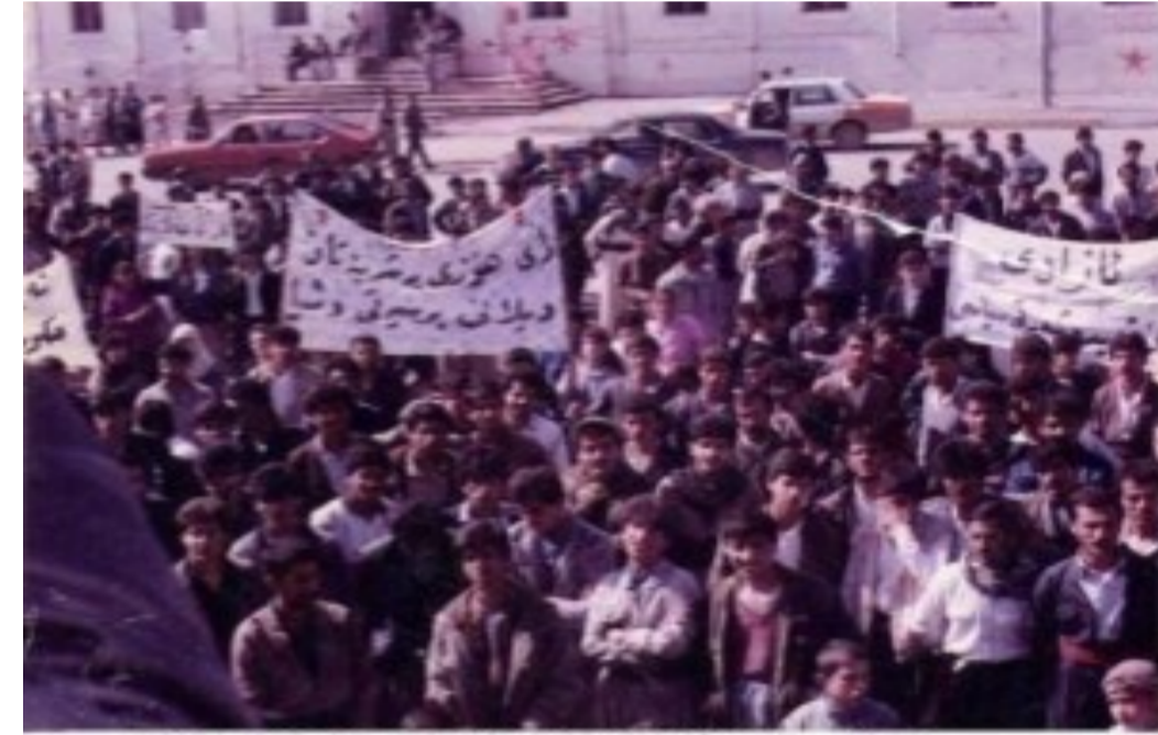
رێتوانی شوراکان له شاری هه ولتیر - نه ورۆزی 1991

بزه مالهیی و حزبی و سه روک عه شیره ت و سه رمایه داران و تالانکاری و سه روکوت و تیرۆر ده گریته. هه م یاسا دانه ر و هه م به رپوه بردنی یاساکان و وه ک هیزیکی رادیکالی و شوپشگیری شار له ژنان و پیاوانی کریکارو کۆمونیست و نازادخواز به بێن جیاوازی خۆی راگه یاندن و ده ستیان کرد به هه لپژاردن له شوینی کار له کارگه کان و شوینی ژبان له گه ره که کاند، وه ده ستیان برد بۆ زۆر له مه سائله کۆمه لایه تی و سیاسیه کانی کۆمه لگه له ده سه لاتی و شیراده رانه و ریکخراوبونی جه ماوه ری و کریکاری.