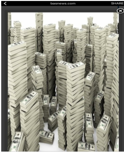
هه رزان فرؤش كرده وه، نهمه ش نه سهره و نه تازه...

به پيى را گه ياندى شيركو جهوده تى نه دنام په رله مانى كوردستان له سهر ليستى يه كگرتوى ئيسلامى، به رپرسيكى هه ريم كه له شارى سليمان نيشته جي يه، خاوه نى 360 شوقه يه له كه نار يه كيك له ده ريا كانى نه لمانيا. كه نرخى هه ر شوقه يه ك بركه ي 500 هه زار دؤلاره... دياره نه وه سهر نيبه كه به رپرسانى حزبى حكومى خاوه نى نه و سامانه و زياتريش بى... بيگومان ژماره ي نه و به رپرسانه كه خاوه نى شوقه و قى لا و به نزيخانه و سامانى زور و زه وه ندى ترى نه قدى و غه يره نه قدين كه م نين و رؤژانه راپورته هه وال له سهر سامانى نه و به رپرسانه بلاوده كرېته وه... نه وه ي جيگاي