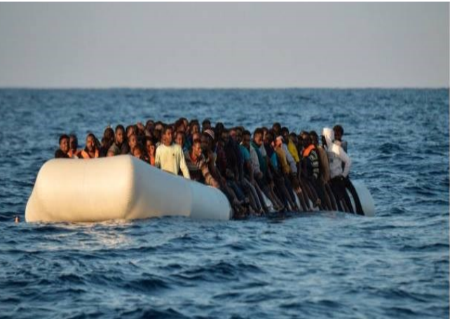
ئينسانانه له جياتى را كردن له م دؤزه خه، ده ستدانه خه بات و تيكؤشانه بۆ سهره ونگون گردنى نهم رؤيمه هارو درنده وه كوتايى هينانه به دؤزه خه ي به رپايان كرده وه.

به پيى را گه ياندى شيركو جهوده تى نه دنام په رله مانى كوردستان له سهر ليستى يه كگرتوى ئيسلامى، به رپرسيكى هه ريم كه له شارى سليمان نيشته جي يه، خاوه نى 360 شوقه يه له كه نار يه كيك له ده ريا كانى نه لمانيا. كه نرخى هه ر شوقه يه ك بركه ي 500 هه زار دؤلاره... دياره نه وه سهر نيبه كه به رپرسانى حزبى حكومى خاوه نى نه و سامانه و زياتريش بى... بيگومان ژماره ي نه و به رپرسانه كه خاوه نى شوقه و قى لا و به نزيخانه و سامانى زور و زه وه ندى ترى نه قدى و غه يره نه قدين كه م نين و رؤژانه راپورته هه وال له سهر سامانى نه و به رپرسانه بلاوده كرېته وه... نه وه ي جيگاي