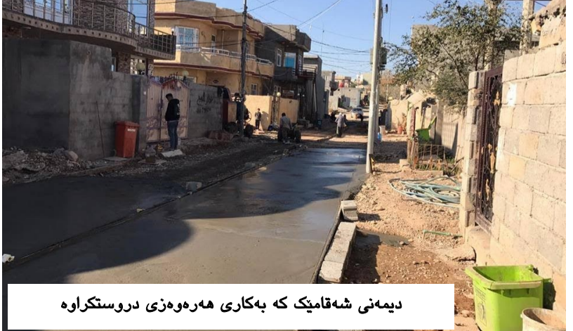
دیمه نی شه قامیک که به کاری ههروهزی دروستکراوه